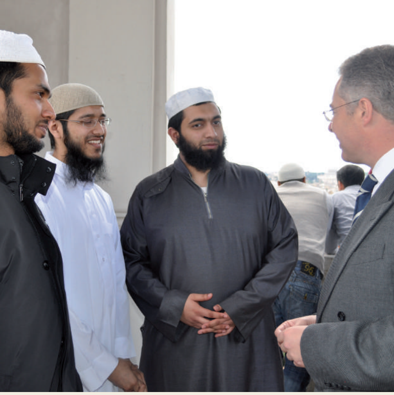
STUDENTS MEET THE BRITISH AMBASSADOR IN ROME