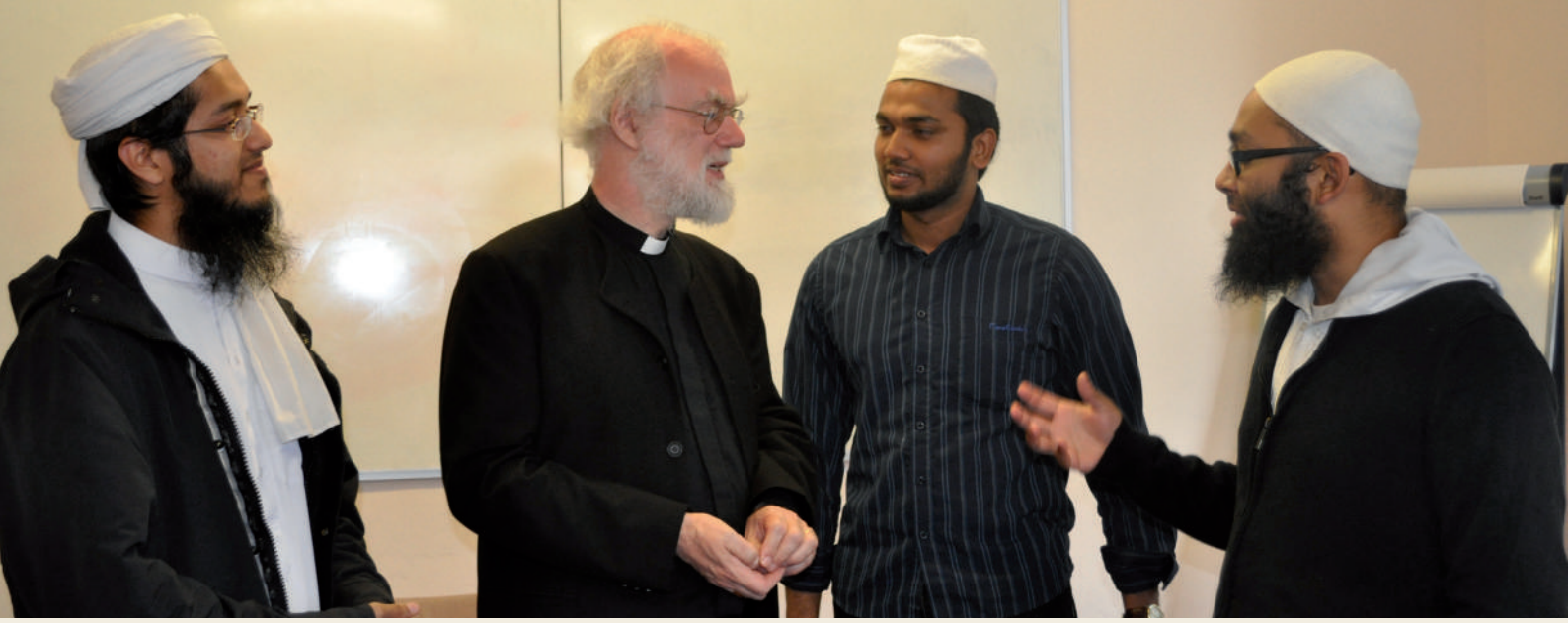
STUDENTS DISCUSS HIS LECTURE WITH DR. ROWAN WILLIAMS يناقش الطلبة محاضرة الدكتور روان وليامز معه

كذلك يقوم الطلبة بعدد من الرحلات الميدانية لرؤية امثلة حية على ارض الواقع تكشف التقدم الرائع المتحقق في التطور المجتمعي والقيادة الدينية ورعاية الأفراد والحوار ما بين الأديان ومجالات مهمة أخرى . وتصل ذروة الرحلات الميدانية بزيارة الى روما والفاتيكان ، حيث يقابل الطلبة البابا، ويلتقون بدبلوماسيين ولاهوتيين ويساهمون في حلقات دراسية خاصة بالحوار ما بين الأديان .