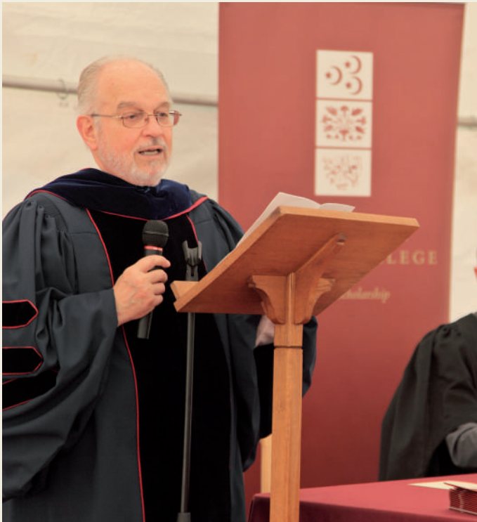
STUDENTS AND STAFF AT THE GRADUATION CEREMONY الطلبة والمدرسون في حفل التخرج

These courses will provide accurate and engaging information about Islam and Muslims to members of the civil service, local government, the police, armed forces, aid organisations, mass media and others. As such they have the potential to be a very beneficial and significant channel to improve the quality of public debate and decision-making on all issues that affect Muslims in Britain and abroad.