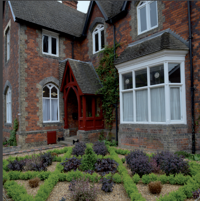
الحديقة الهندسية التابعة للكلية THE COLLEGE'S GEOMETRIC GARDEN