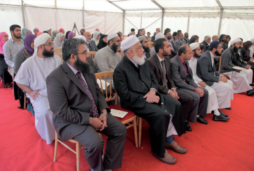
GRADUATION CEREMONY حفل التخرج