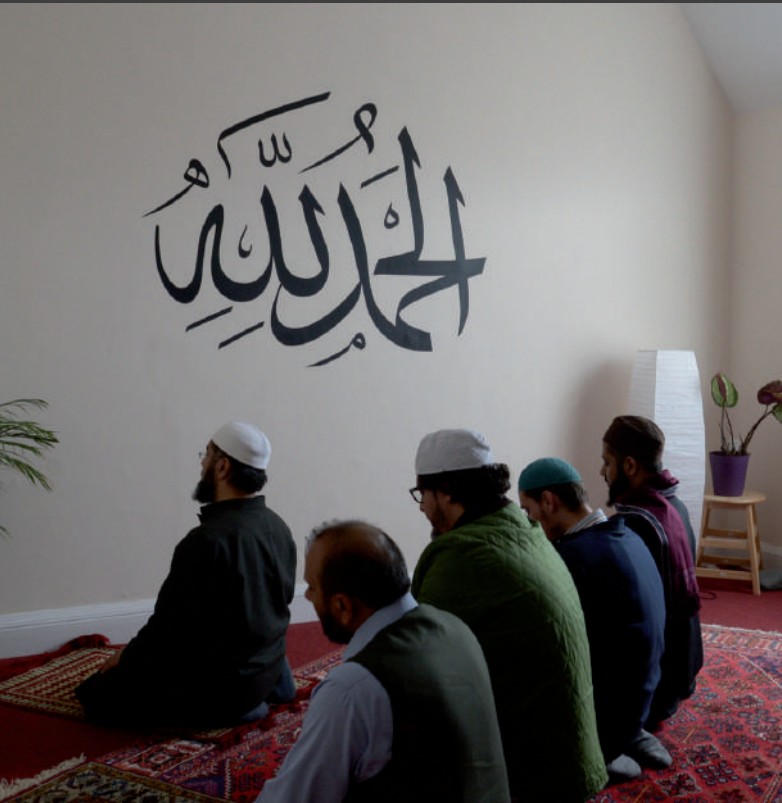
THE COLLEGE PRAYER ROOM مصلى الكلية